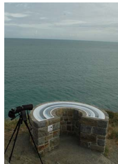
Les pélagiques, comme le Puffin des Baléares, peuvent s'observer à partir de la Pointe des Guettes.

L'espèce disparaît habituellement de la région en octobre-novembre, ne laissant que quelques individus jusqu'en janvier, beaucoup plus rarement quelques dizaines d'oiseaux. Mais un phénomène sans précédent en Bretagne a été observé au cours de l'hiver 2007-2008, des centaines de Puffins des Baléares étant restés hiverner sur ces côtes.